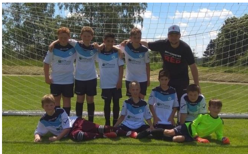
Tým mladších žáků Cejle