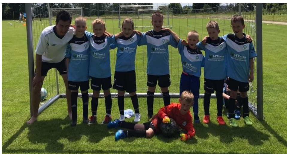
Tým mladší přípravky Cejle/Kostelec