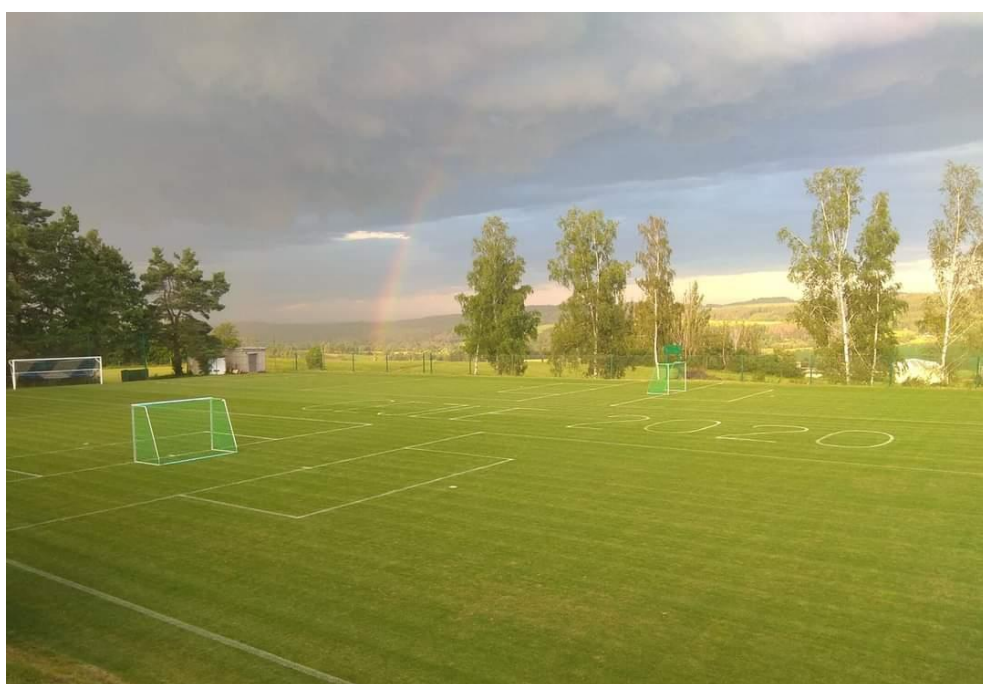
20. ročník turnaje v malé kopané